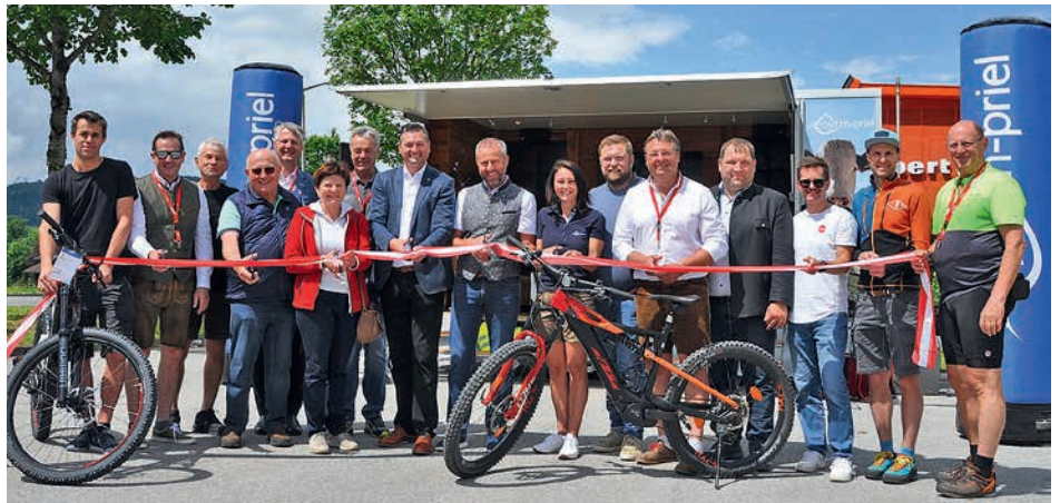
Gruppenbild der Bike & Hike Eröffnung

Realisiert wurde das Projekt durch eine zukunftsweisende Kooperation zwischen Tourismus, Land und Gemeinden, Grundbesitzern, Gastronomen, Partnern aus dem Sporthandel- und -verleih sowie ausschließlich oberösterreichischen Unternehmen. Diese Zusammenarbeit sorgt einerseits für eine höhere Besucherfrequenz und andererseits für eine Verkehrsentlastung vor Ort, wovon alle Beteiligten profitieren. Die Eröffnung des Bike & Hike Angebots war ein gelungener Start in die Sommersaison und verspricht Outdoor-Fans viele spannende Erlebnisse in Pyhrn-Priel.