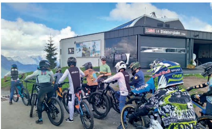
Die 2. Klasse trainierte mit Downhill Weltcupfahrer Andi Kolb in Saalbach