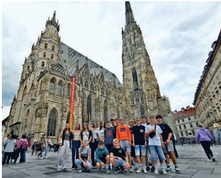
Ab nach Wien hieß es für die 4. Klasse.

Unsere Schülerinnen und Schülern wünschen wir in den Sommerferien erholsame Wochen und viel Spaß in der Sonne!