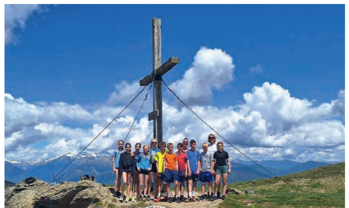
Die 3. Klasse stürmte die Gipfel in Kärnten